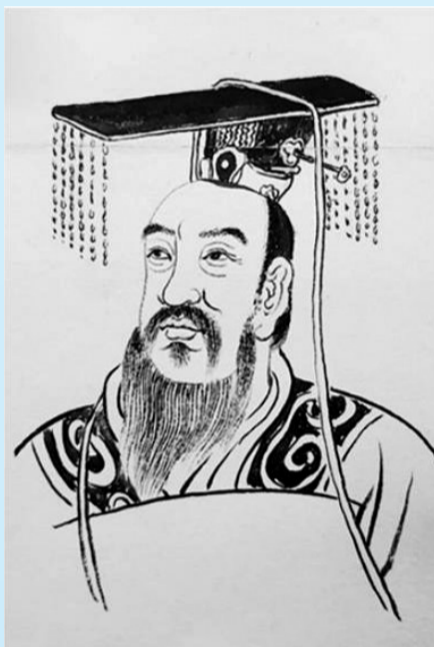
商王祖乙像 (姚卫国绘)。

从展厅里的匠心讲解到沉浸式的民俗体验，从校园里的公益科普到报告厅的科普讲座，郭守敬纪念馆的巾帼团队，以女性的温柔与坚韧，以实干与担当，将郭守敬文化的传承融入每一场活动、每一次服务。这支以女职工为核心的团队，用点滴巾帼之光，汇聚成守护与传承守敬文脉的星河。未来，她们将继续擦亮守敬文化品牌，丰富科普活动形式，提升文化服务品质，用心讲好郭守敬的故事，讲好中国科技的故事，以巾帼之力，守护千年文脉，赋能美好未来。