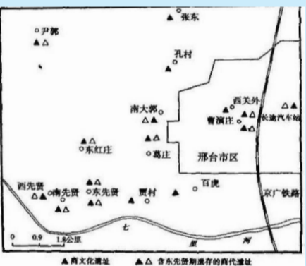
邢台城区附近主要商代文化遗址分布图。