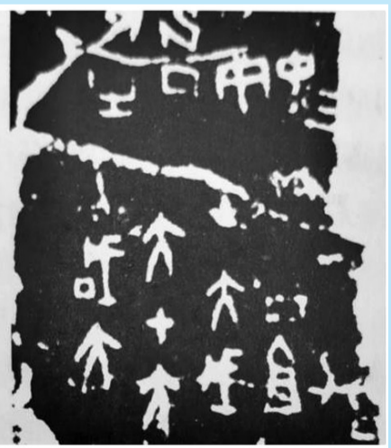
祭祀祖乙等商王的甲骨文，卜辞内容为：“侑于成、大丁、大甲、大庚、大戎、中丁、祖乙”。